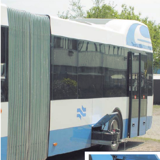
Accuride® Teleskopschienen in einem Verkehrsbus – Typ 0522. Stoß – und vibrationsresistent in mobilen Anwendungen