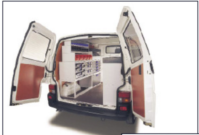
Accuride® Teleskopschienen in einem Transporter – Typ 3607. Teleskopschiene mit Verriegelung in geöffneter Position