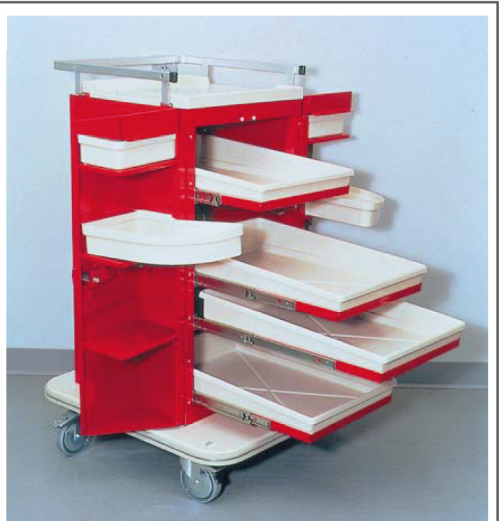
Accuride® Teleskopschiene in einem Trolley – Typ 3832. Mit herausnehmbaren Schubladen