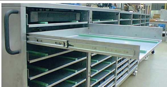
Accuride® Teleskopschiene in einem Geräteschrank – Typ 3832. Hohe Einbautoleranz für eine nicht genormte Montage.