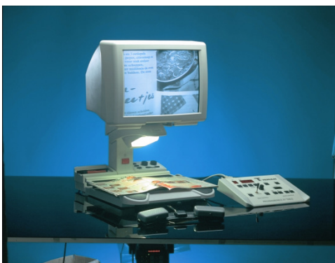
Accuride® Teleskopschiene in einer Lesetafel unter einer Bildschirmleuchte. Kompakte Schiene mit großer Auszuglänge